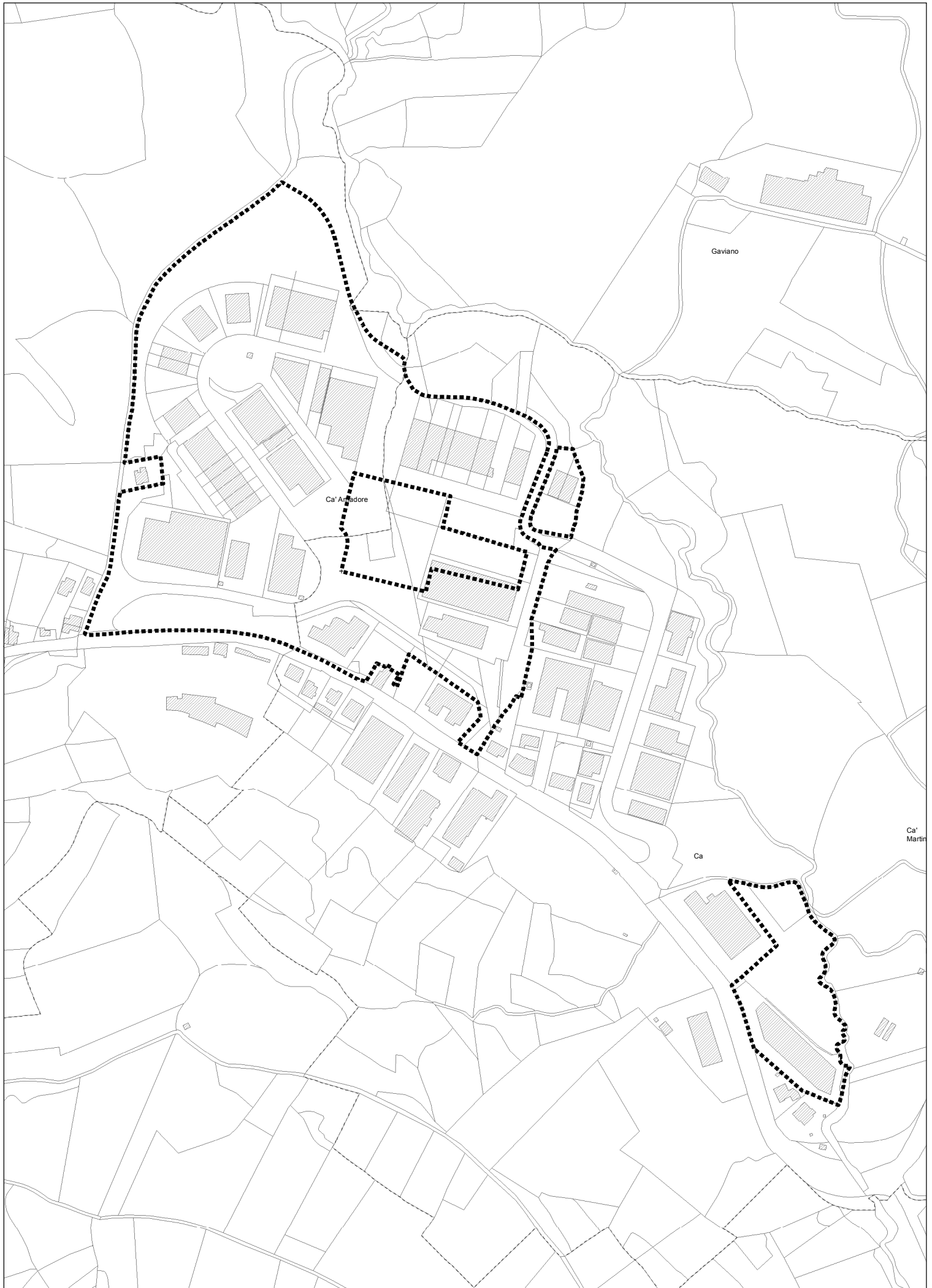
Perimetro P.P. Zona D107 Cà Amadore